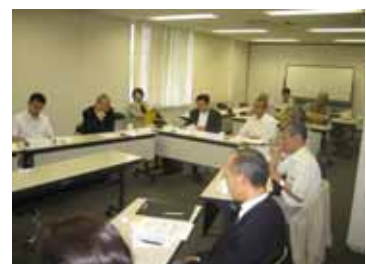
真剣に聴講し、そして各自の経験や悩みを語り合う出席者