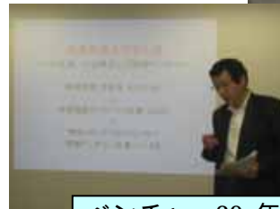
ベンチャー 20 年の経験から“一人ビジネスを始めよう!”を話す龍岡講師 (司会者兼務)